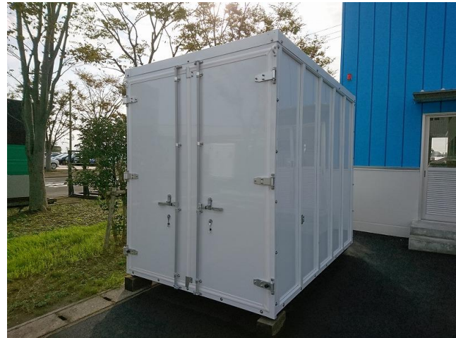
試作検証(コンテナ外観)