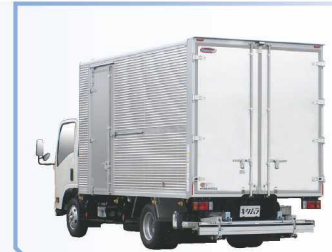
リフトテーブル格納