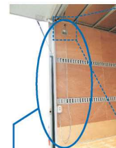
室内コード付 リモコンスイッチ