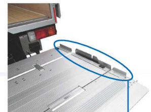
サイドストッパー