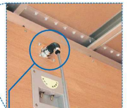
室内リモコンコード用 メタルコンセント