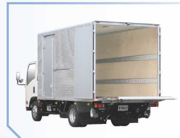
リフトテーブル展開