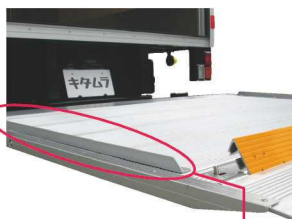
サイドストッパー