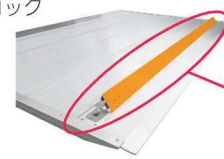
キャストーストッパー (簡易式)