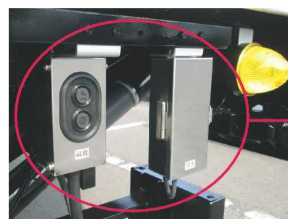
室外リモコンSWステンレス製格納BOX