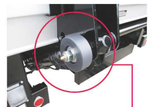
引きずり防止ローラー