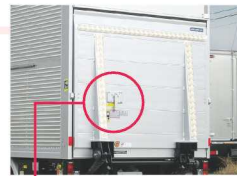
ワンタッチロック