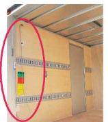
室内コード付 リモコンスイッチ