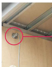
室内リモコンコード用メタルコンセント