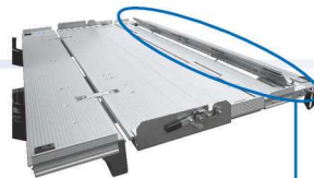
キャスターストッパー