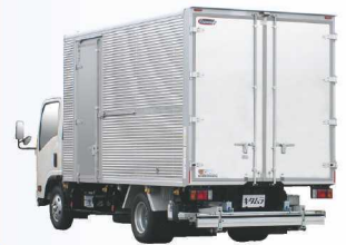
リフトテーブル格納