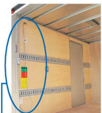
室内コード付 リモコンスイッチ