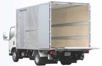
リフトテーブル展開