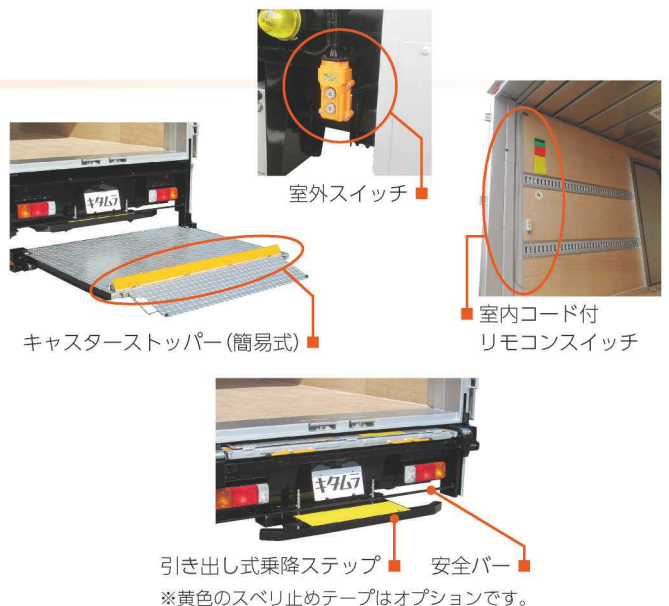
引き出し式乗降ステップ ■ 安全バー ※黄色のスベリ止めテープはオプションです。