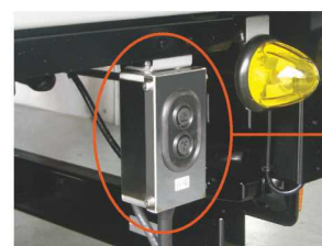
■ 室外リモコンSWステンレス製格納BOX