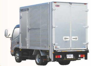
リフトテーブル格納