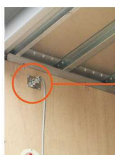
■ 室内リモコンコード用メタルコンセント