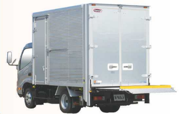
リフトテーブル展開